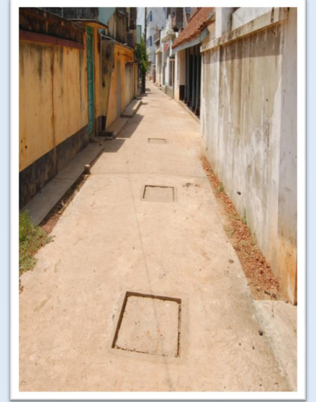
Under ground drain (UGD) under construction and UGD after completion