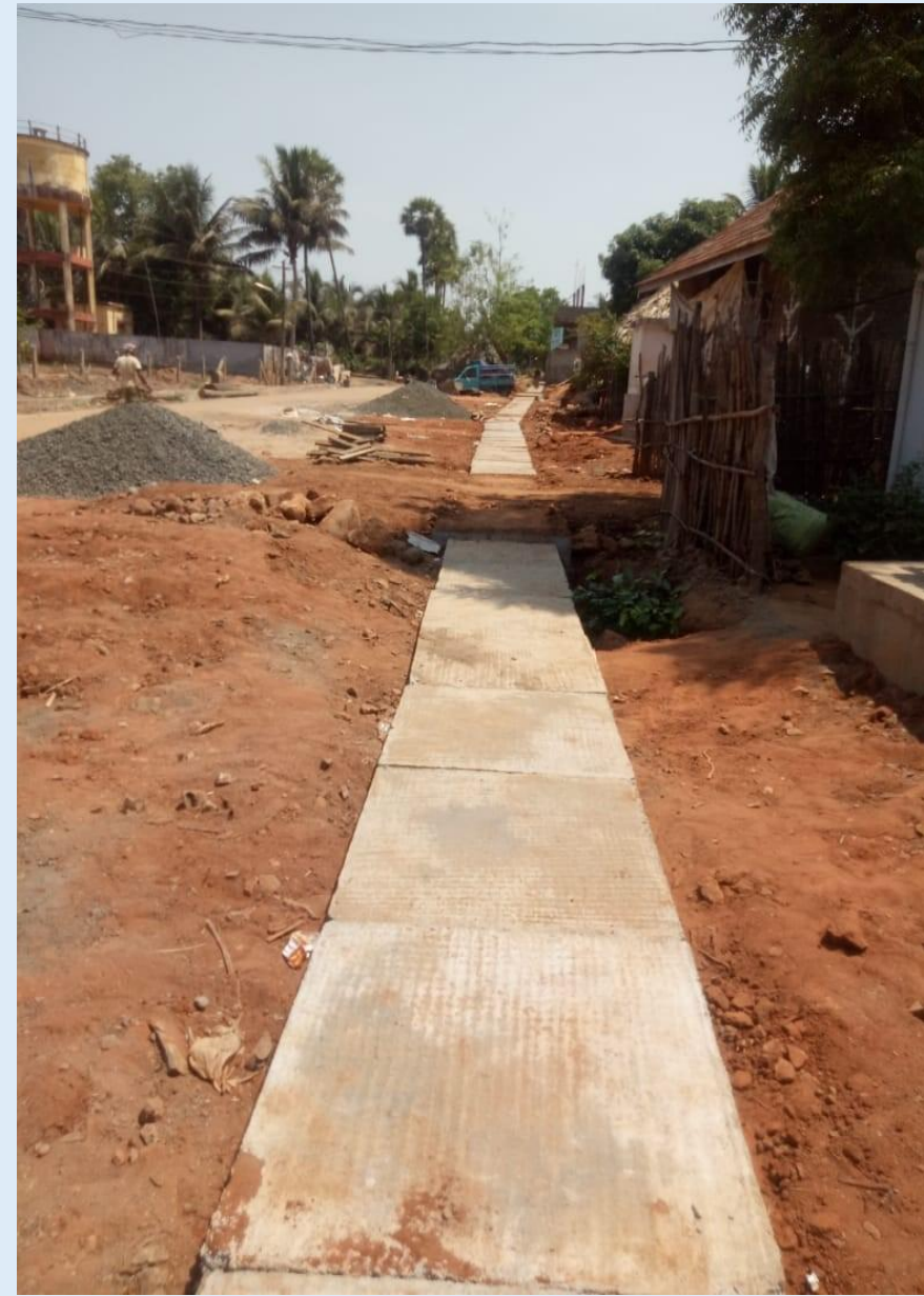
Open drain covered with slabs