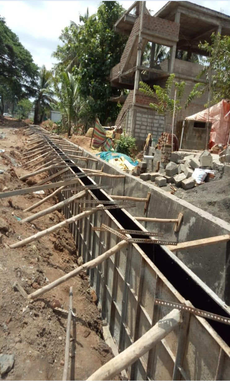
Open drain under construction