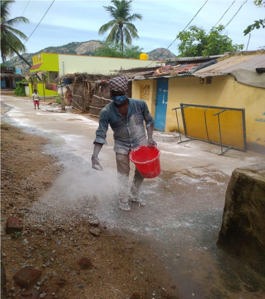
Applying Bleaching powder