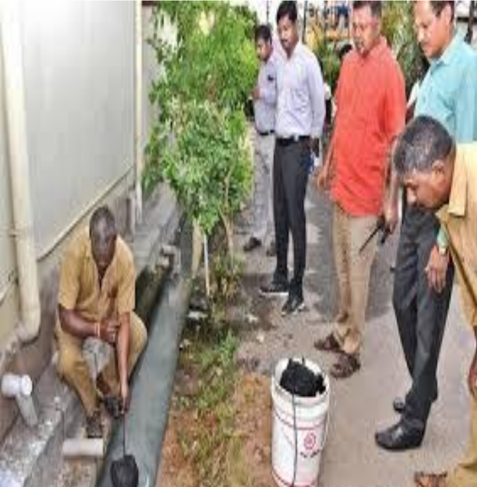
Waste Oil balls dropping